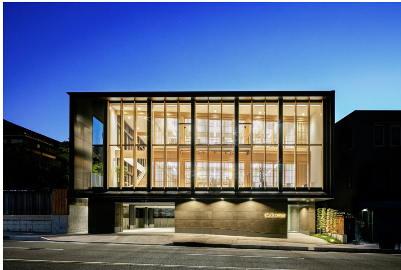
金沢の都市景観を意識した周囲になじむ外観デザイン