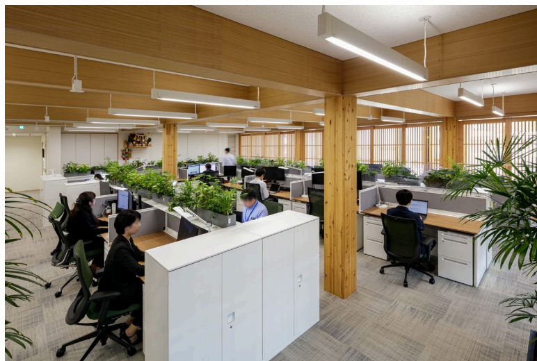
働き手が快適で健康的に過ごすことができる執務環境