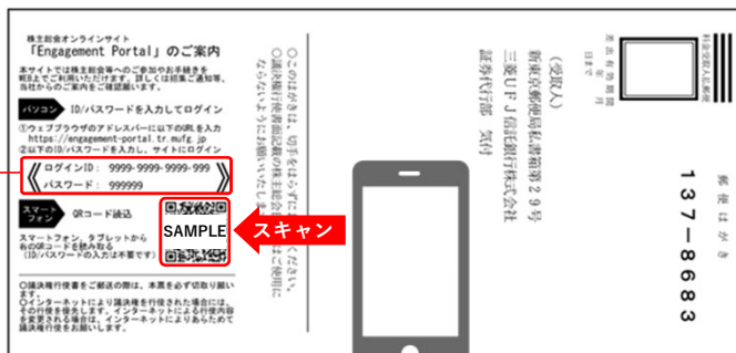
（議決権行使書裏面イメージ）