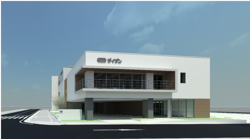
ダイダン四国支店『(仮称) エネフィス四国』竣工予想図

ダイダン株式会社（本店：大阪市西区、社長：藤澤一郎）は、香川県高松市に建設中のダイダン四国支店（通称：エネフィス四国）が、建築物エネルギー評価制度（BELS）にて最高ランクの「5☆」と、正味でゼロ・エネルギーである『ZEB』（＝完全なZEB）に認定されたことをお知らせします。