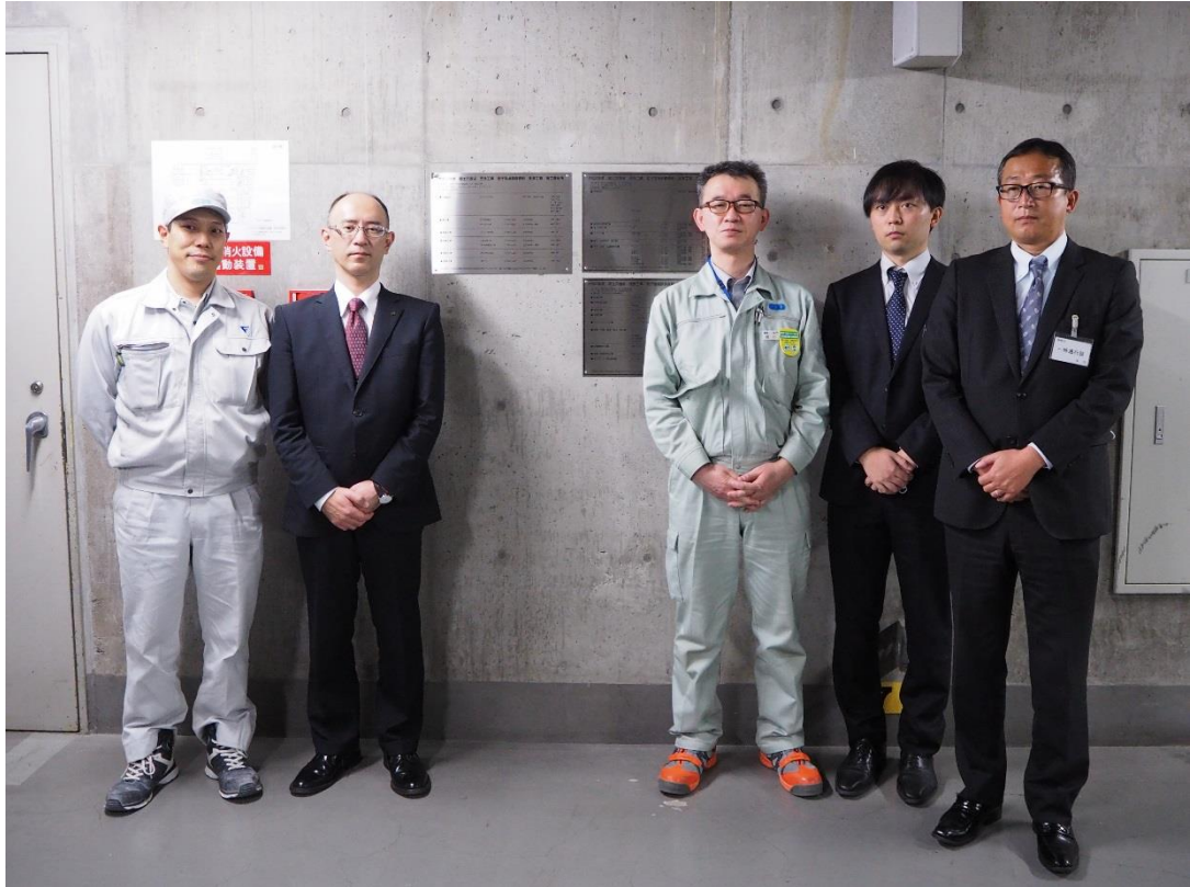
ダイダン受賞者一同