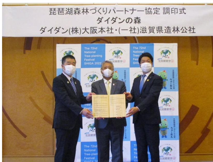
琵琶湖森林づくりパートナー協定調印式（3月17日）

森林は、二酸化炭素を吸収し、多様な生物を育み、豊かな水の恵みをもたらすことから、ダイダンがその育成を支援することは、企業スローガン『光と空気と水を生かす』との親和性も高く、サステナブルな社会の実現に向け価値が高いと考えます。ダイダンでは、国内の本社、支社、支店のある10ヵ所で各自治体と協定を結び、全社的に森林育成活動を進めることとしました。